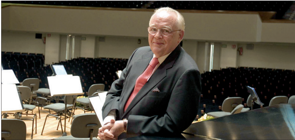
El pianista Joaquín Soriano, que participa en el festival Reino de León. REDACCIÓN