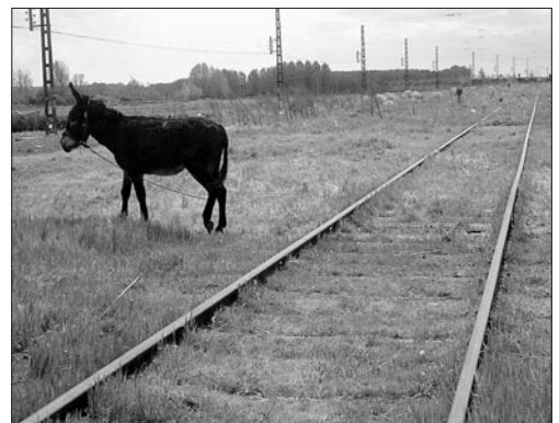
Las abandonadas líneas férreas de un tren que ya no existe. JESÚS